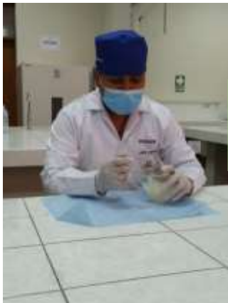
Preparación del Gel Geranium delisianum knuth