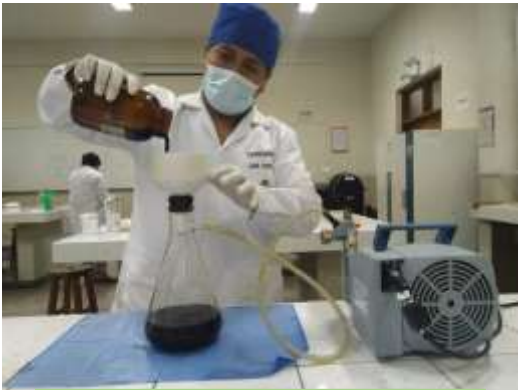
Filtrado macerado de Geranium delsianum knuth , a través de máquina de aire