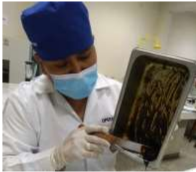
Extracto hidroalcohólico polimerizado totalmente seco