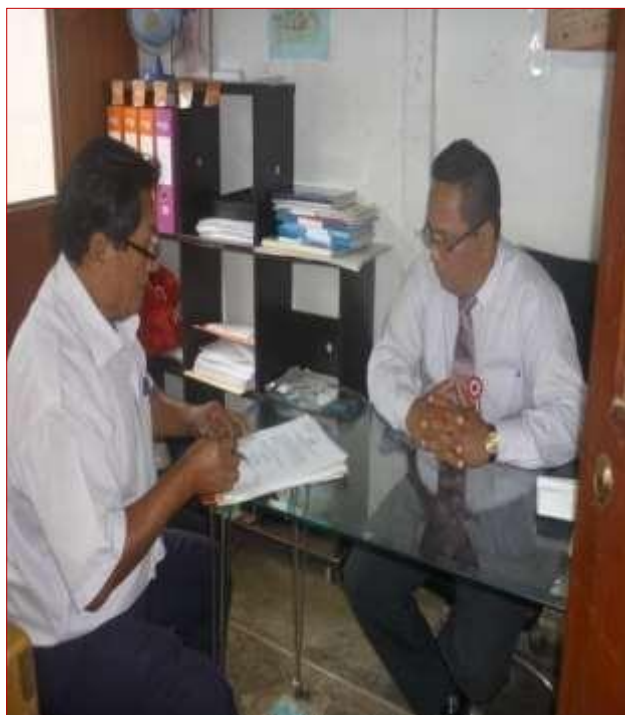
ENCUESTA APLICADA A DIRECTOR DE LA I.E.P. MARIA AUXILIADORA