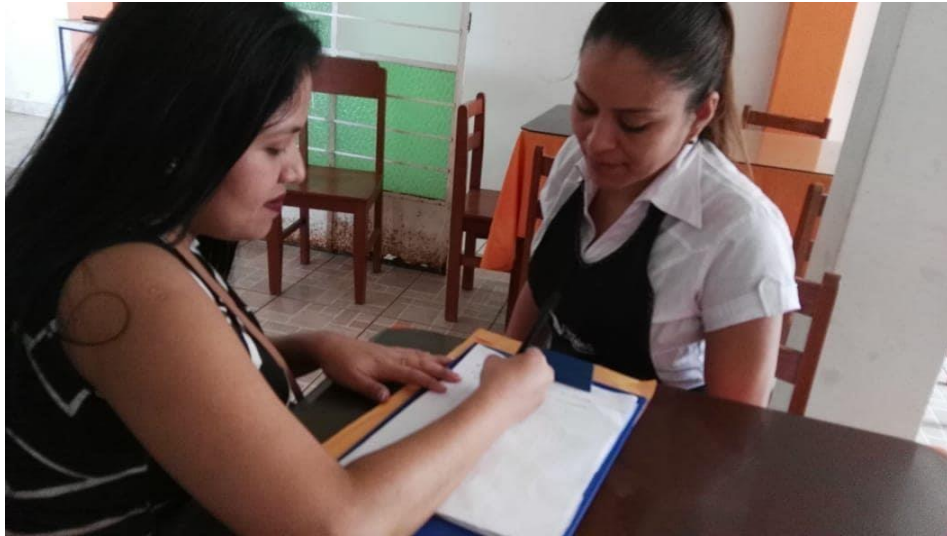
ENCUESTA APLICADA A LA PROPIETARIA DE LA CEVICHERÍA LOS ÁNGELES